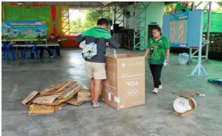
รูปภาพการดำเนินโครงการ/กิจกรรม