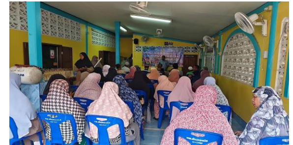
การติดตามและประเมินผลแผนพัฒนาท้องถิ่น : เทศบาลตำบลต้นหยงมัส