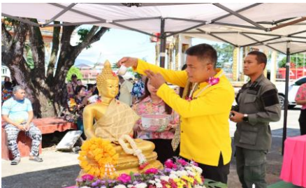
รูปภาพการดำเนินโครงการ/กิจกรรม