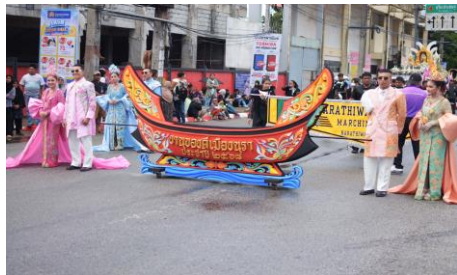
รูปภาพการดำเนินโครงการ/กิจกรรม