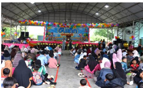
รูปภาพการดำเนินโครงการ/กิจกรรม