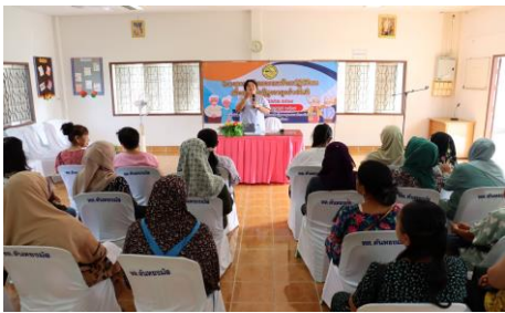
รูปภาพการดำเนินโครงการ/กิจกรรม