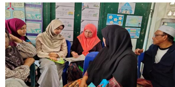
การติดตามและประเมินผลแผนพัฒนาท้องถิ่น : เทศบาลตำบลต้นยางมีส์