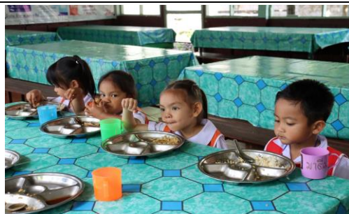
รูปภาพการดำเนินโครงการ/กิจกรรม