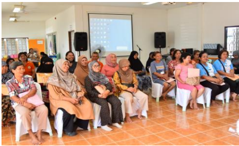
รูปภาพการดำเนินโครงการ/กิจกรรม