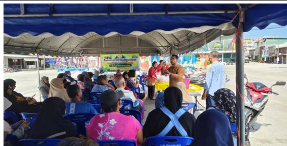
รูปภาพการดำเนินโครงการ/กิจกรรม