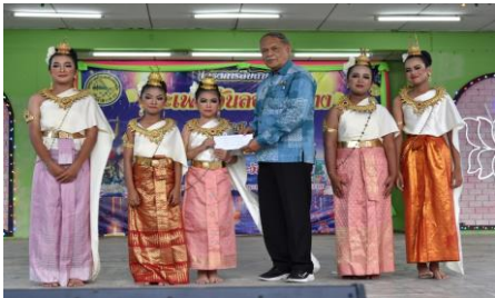
รูปภาพการดำเนินโครงการ/กิจกรรม