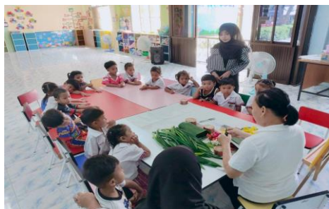
รูปภาพการดำเนินโครงการ/กิจกรรม