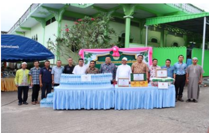
รูปภาพการดำเนินโครงการ/กิจกรรม