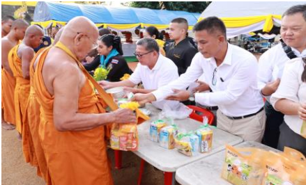
รูปภาพการดำเนินโครงการ/กิจกรรม