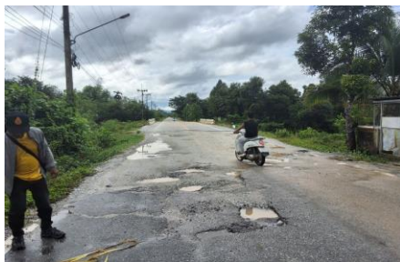
รูปภาพการดำเนินโครงการ/กิจกรรม