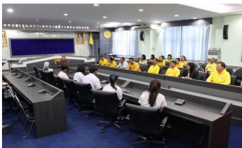
รูปภาพการดำเนินโครงการ/กิจกรรม