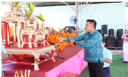
รูปภาพการดำเนินโครงการ/กิจกรรม