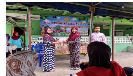
การติดตามและประเมินผลแผนพัฒนาท้องถิ่น : เทศบาลตำบลต้นหยงมัส