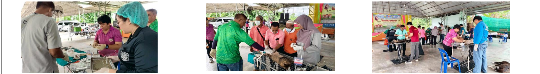
การติดตามและประเมินผลแผนพัฒนาท้องถิ่น : เทศบาลตำบลต้นยางมีส