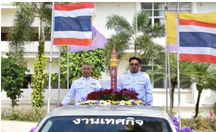
รูปภาพการดำเนินโครงการ/กิจกรรม