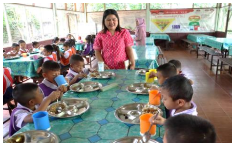
รูปภาพการดำเนินโครงการ/กิจกรรม