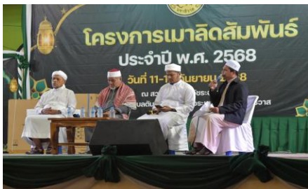
รูปภาพการดำเนินโครงการ/กิจกรรม