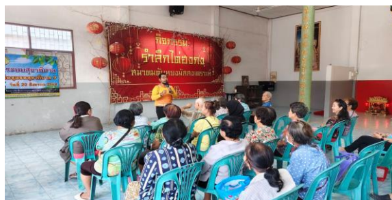
รูปภาพการดำเนินโครงการ/กิจกรรม