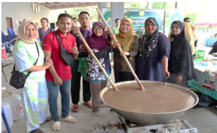
รูปภาพการดำเนินโครงการ/กิจกรรม